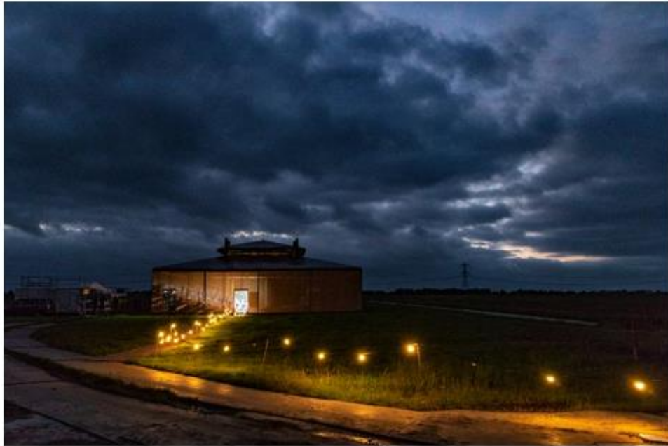
De theaterten van Toneelgroep Jan Vos.